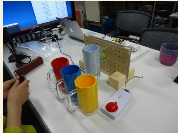
ジョッキを並べた様子