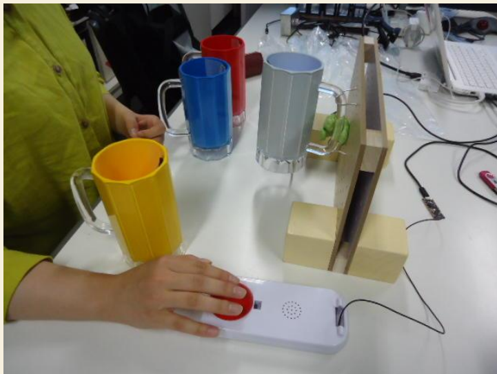
赤いボタンで画面を進める